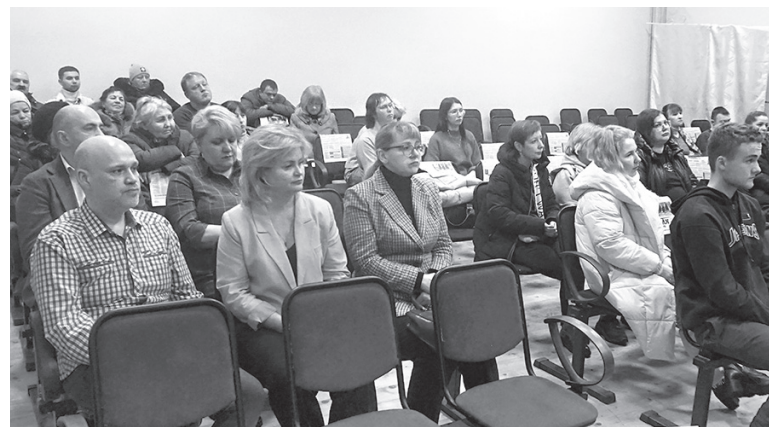
Участники встречи в Ширинье

законодательством. Решения об изменении зон охраны таких объектов принимает орган государственной власти субъекта РФ по согласованию с федеральным органом охраны объектов культурного наследия.