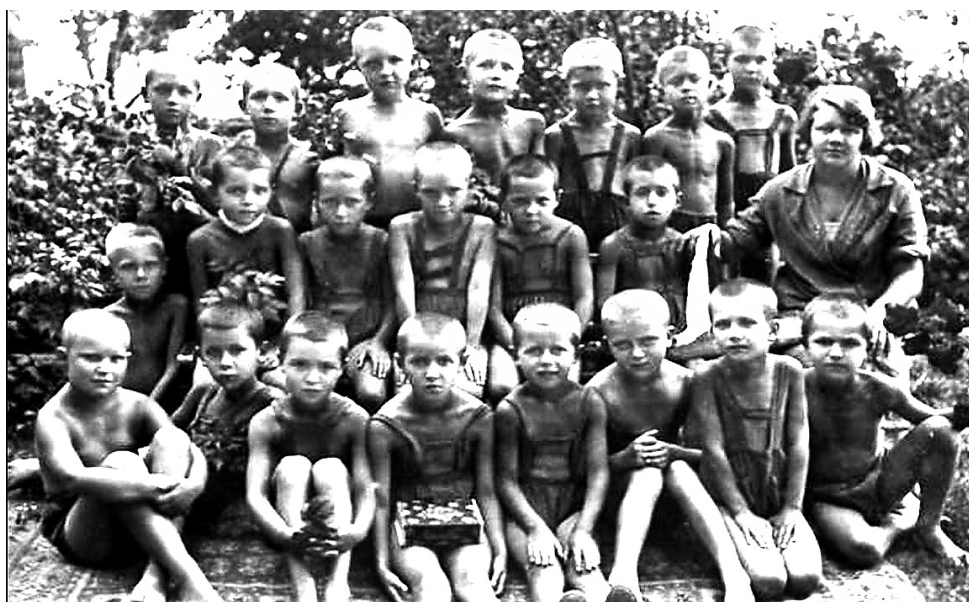
Группа детского дома.