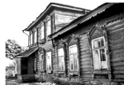
Здание детского дома на ул. Пекарской. 2006 год

«Я всегда вспоминаю годы жизни в нашем доме и всем говорю, что эти годы жизни были самые лучшие», – призналась в своих воспоминаниях Татьяна Егорова.